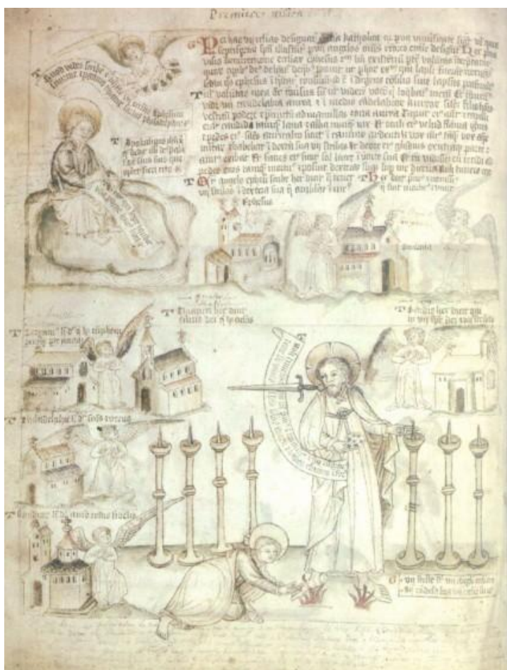
Святой Иоанн Евангелист пишет Святой Откровение в ссылке на острове Патмос. Тюрингия, ок. 1425-1450 гг., Нью-Йоркская публичная библиотека, NYPL MA 015, f. 1v,

Точная ссылка на Евангелие от Матфея обосновывает постоянное бегство и подпольную жизнь «Церкви, которая бежит и прощает». Она соответствует той, которую использует добрый человек Пейре Отье; и все это отвечает цитатам из евангелиста Иоанна, следуя которым, диссиденты XII-XIV веков ставили себя вне сферы мирских устремлений. Особенно заметна у рейнских апостолов тема оппозиции между двумя Церквями – Церковью Божьей и Церковью мира сего, вдохновленная темой противостояния между Богом и миром, развиваемой евангелистом Иоанном: «Мир ненавидит нас, как он ненавидел и преследовал Господа Нашего», - говорил Пейре Отье. Эти - безусловно христианские - корни дуализма иллюстрируются притчей о благом и дурном деревьях, которые соответственно приносят благие и дурные плоды. Этот лейтмотив в дальнейшем постоянно присутствует в проповедях «катаров» – дурные плоды этого мира свидетельствуют только о его дурном происхождении: «Лживые апостолы, изменившие Слову Христову, вы ищете тех, кому вы принадлежите, вы свернули с пути, вы и отцы ваши. Мы же и отцы наши – наследники апостолов и остаемся ими по благодати Христовой, и так будет до конца времен. И чтобы различить вас и нас, Христос сказал: «По плодам их узнаете их» (Мт. 7:16). Наши плоды – это наследование Христа».